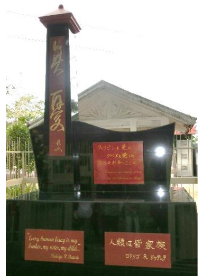
ミンタル「無憂の碑」

の中で「人類は皆家族」「どの国とも家族のように触れ合う」ことの大切さ、重要性を味わうことができます。