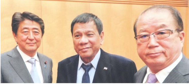
安倍総理、ドゥテルテ大統領、網代JPVA顧問

この写真は首相主催の歓迎晩さん会に招待された時の写真です。また安倍首相は1月13日にダバオに来られドゥテルテ大統領私邸で朝食を取り、ミンダナオ